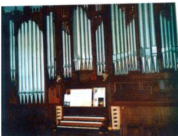
L'orgue, photographié avant la dépose.

Le registre de Montre est en partie en façade de l'instrument - montré d'où son nom. Ici seuls les tuyaux en façade existent.